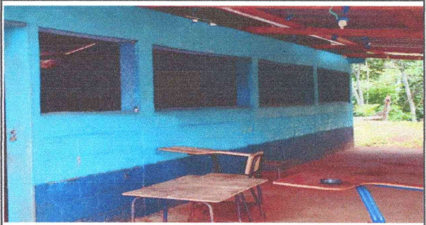
Foto 4: Sustitución de ventanas de madera y malla, por balcones de metal.