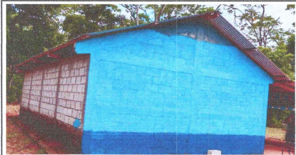
Foto 5: Instalación de canales de metal con bajadas de pvc para agua pluvial y aplicación de pintura a dos manos en exterior.