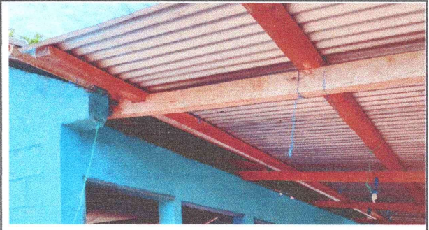
Foto 2: Montaje, instalación y suministro de cubierta de laminas troqueladas.