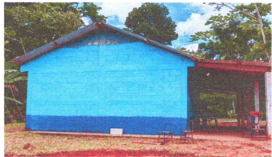
Foto 6: Aplicación de dos manos de pintura en exterior del establecimiento.

Observación: Si es necesario se pueden agregar hojas adicionales y actualizar el número de hojas.