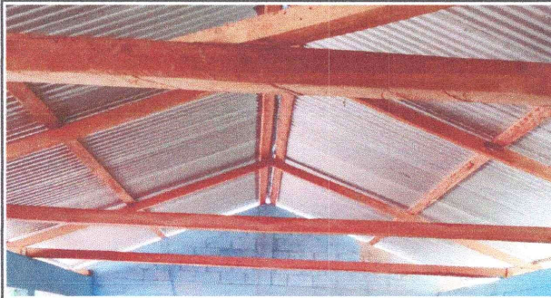
Foto1: Desmontaje y sustitución de estructura de madera por estructura de metal